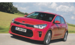
Klein und sportlich: der neue Kia Rio.

Die Koreaner haben wieder ein neues Auto auf den Markt gebracht. Es ist ein Kleinwagen, der sich durch sein Preis-Leistungs-Verhältnis auszeichnet. Das neue Rio ist ein Kleinwagen, der sich durch sein Preis-Leistungs-Verhältnis auszeichnet. Das neue Rio ist ein Kleinwagen, der sich durch sein Preis-Leistungs-Verhältnis auszeichnet.